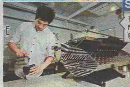
Share 荷蘭手造咖啡機 Mirage能沖出優質咖啡。