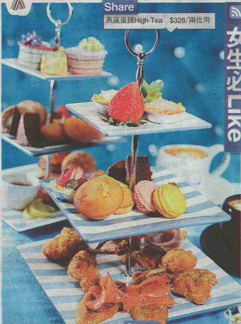
Share 燕窩蛋撻 High Tea $328/兩位用